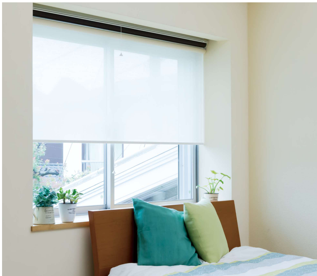
手前生地：TR-1109 ネムロブラウン / 奥生地：TR-1592 ナチュラル